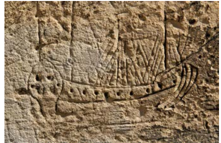
Graffiti présent sur la tour Puchot du château de Caen

La Normandie a connu de tout temps une grande activité maritime, tournée d'abord vers le commerce maritime européen, puis vers l'Afrique, l'Amérique du Sud et l'Asie. Elle est largement impliquée dans tous les aspects des activités maritimes, que ce soit dans la construction navale, la pêche, le cabotage, les voyages lointains vers l'Afrique, l'Amérique du Sud, les Antilles et le Canada. Les marins impliqués dans ces diverses activités laissèrent de nombreux témoignages gravés sur les murs des églises, de bâtiments civils et de châteaux normands. Les navires représentés sont de types très divers allant de la chaloupe au grand vaisseau de guerre. Ces graffitis constituent de véritables documents archéologiques et historiques, nous fournissant de précieuses informations sur l'aspect général de ces navires, de leur coque et leur gréement. Ils complètent ainsi les descriptions de navires de pêche et de commerce des 16 e et 18 e siècles, fournies par les contrats de construction et de vente de navires conservés dans les archives normandes.