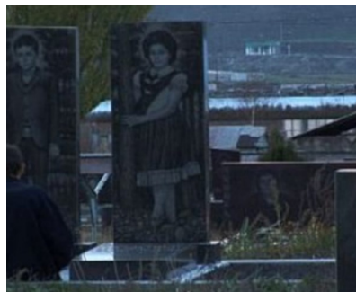
Gyumri (68 mn, VO - sous-titré en français)

Le contexte social-historique et culturel dans lequel survient une catastrophe conditionne la manière dont chacun va durablement et psychologiquement vivre l'événement, et le tremblement de terre à Léninakan en 1988 n'échappe pas à cette règle, comme en témoigne le film documentaire rare qui sera projeté avant la conférence-débat : Gyumri , de Jana Sevcikova (Tchécoslovaquie, 2008) : « Vingt ans après (le tremblement de terre à Léninakan, devenue Gyumri), les familles n'ont toujours pas fait le deuil de leurs enfants disparus. Cette impossibilité d'accepter la mort a engendré des croyances irrationnelles et des rituels obsessionnels où les anges, les fantômes et les doubles mènent la danse... » (Yann Lardeau, Film-Documentaire.fr).