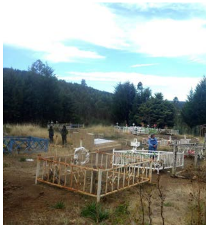
Cimetière mapuche de Perez Neyez. Sector Ranquico chico (Camille Varnier, 2014)

MERCREDI 22 SEPTEMBRE | 16H00 >SALLE DES ACTES DE LA MRSH (SH 027)