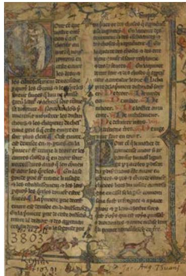
Grand coutumier de Normandie, BNF, Français 5961

Nous proposons un parcours de son histoire, du Moyen Âge à l'époque moderne, et présentons le projet ConDÉ, qui s'est dédié, depuis 2018, à sa préservation numérique.